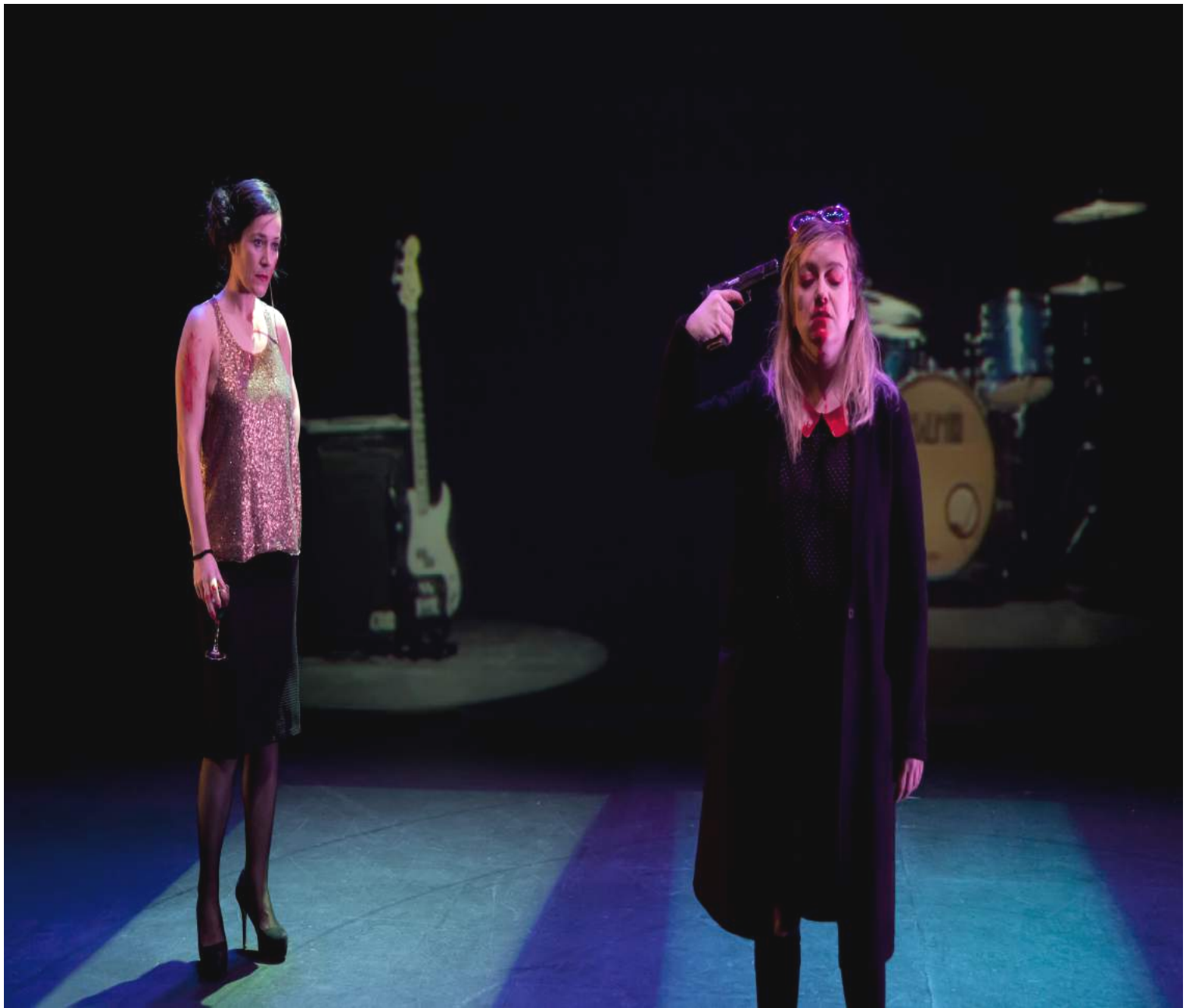
Argazkia Son Aoujil