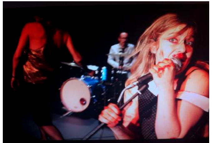
Malmö (Khea Ziater)