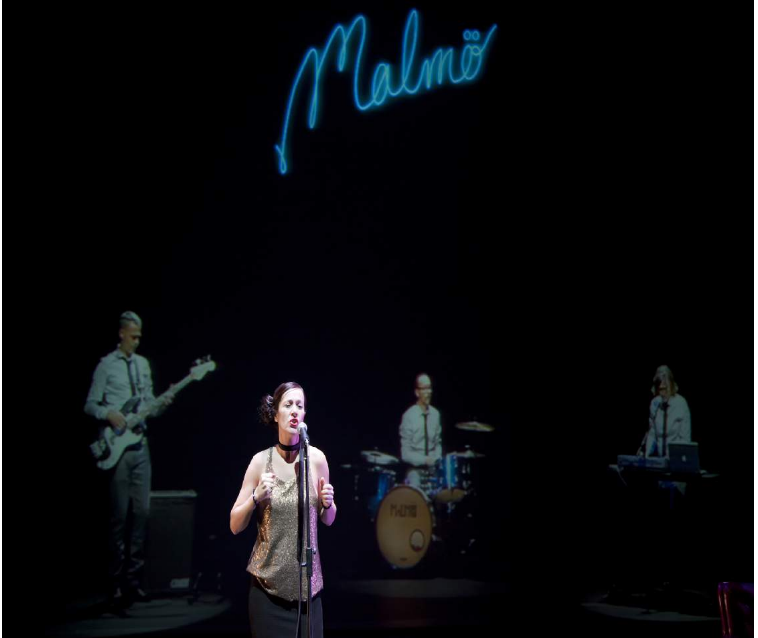
Argazkia Son Aoujil