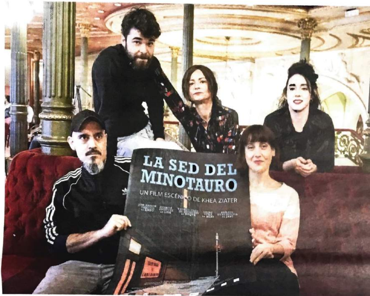
'La sed del minotauro' es la octava vez en la que Khea Ziater utiliza un lenguaje que mezcla códigos del cine con los del teatro.