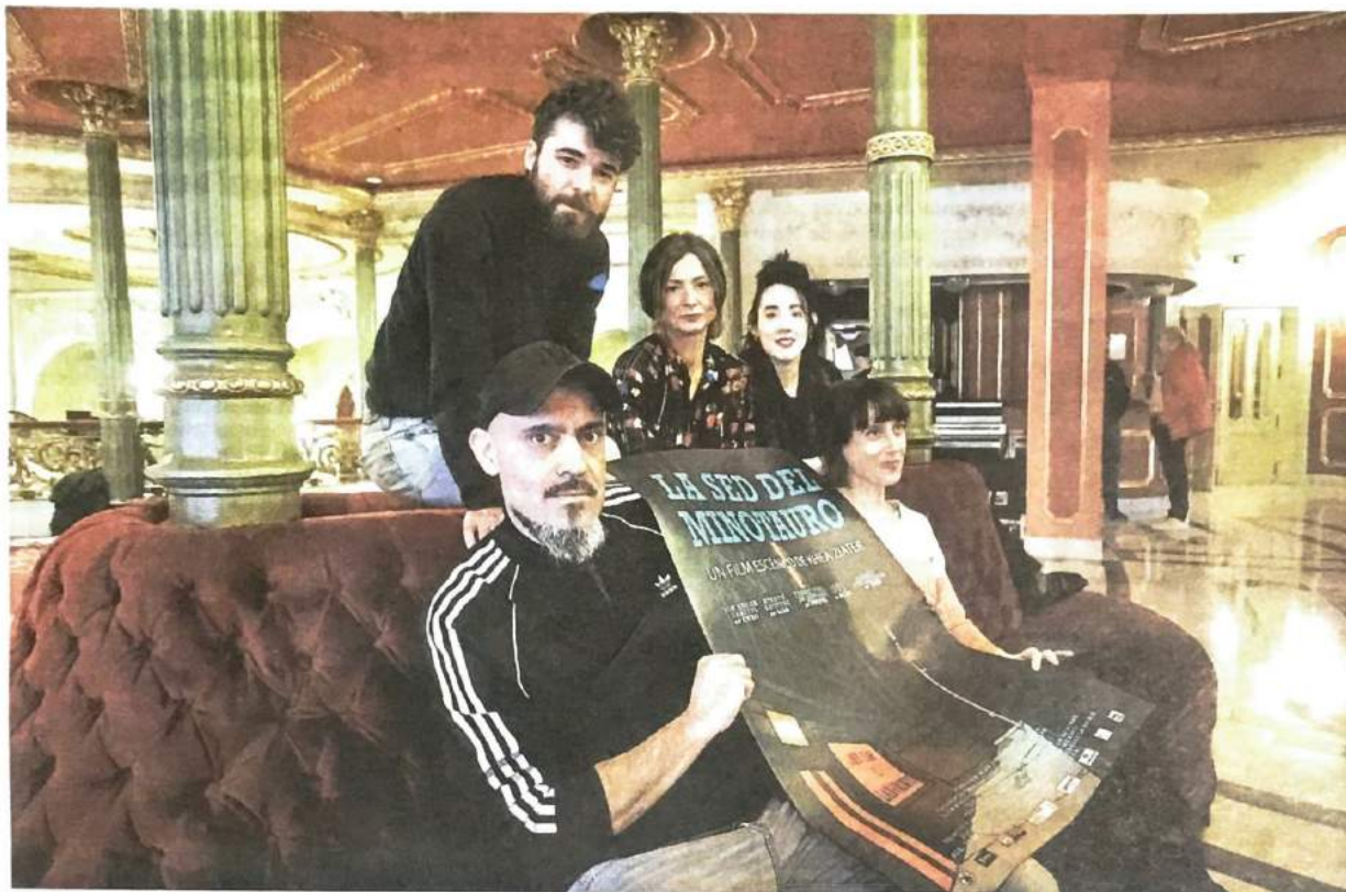
Actores y director durante la presentación ayer de la obra en el teatro Arriaga. JORDI ALEMANY