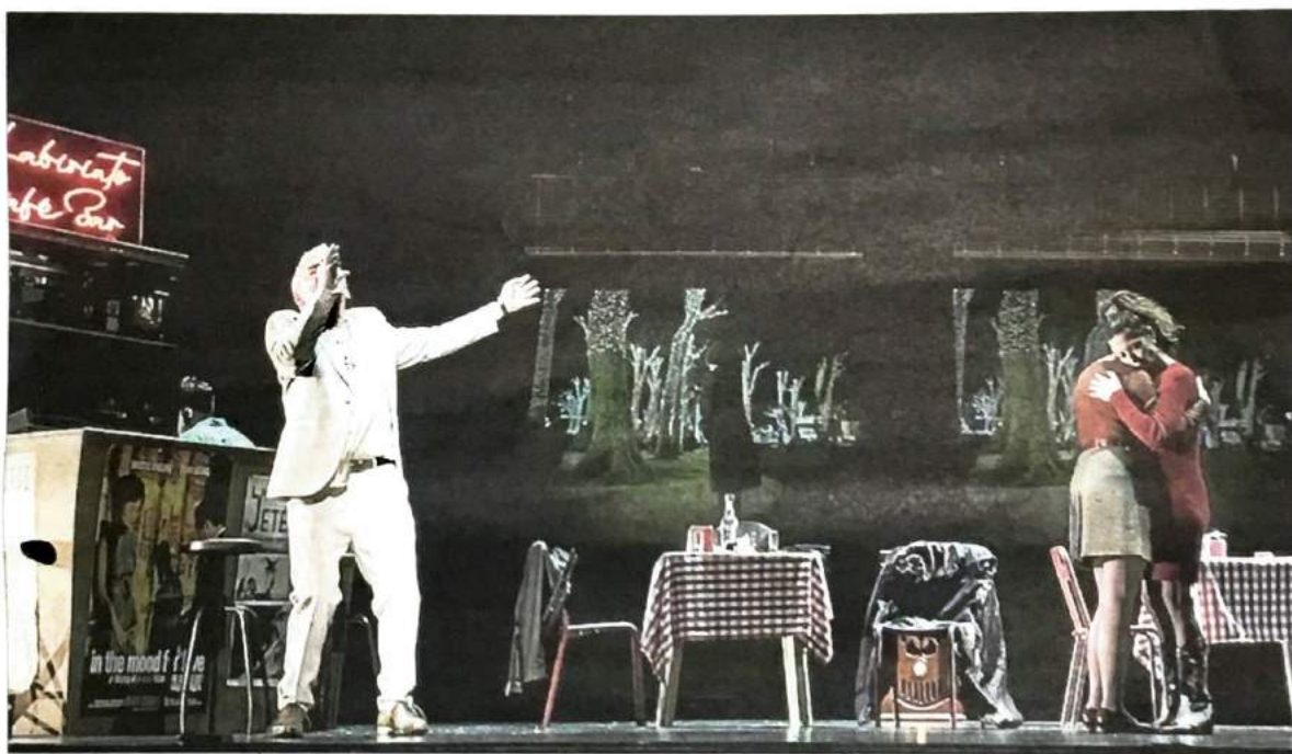
Estrenarán la obra en el Teatro Arriaga este viernes. ARRIAGA ANTZOKIA

Para narrar esta historia, han fusionado códigos propios del teatro con otros cinematográficos. Sobre el escenario habrá pantallas que harán las veces de ventanas que se abren al exterior, para mostrar